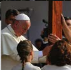
Immagini dall'Happening degli Oratori dei giovani per l'incontro con Papa Francesco (19-22 giugno 2015)