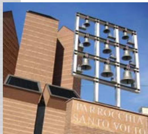
A sinistra campane e in basso cortile interno del complesso S. Volto, sede della Curia metropolitana