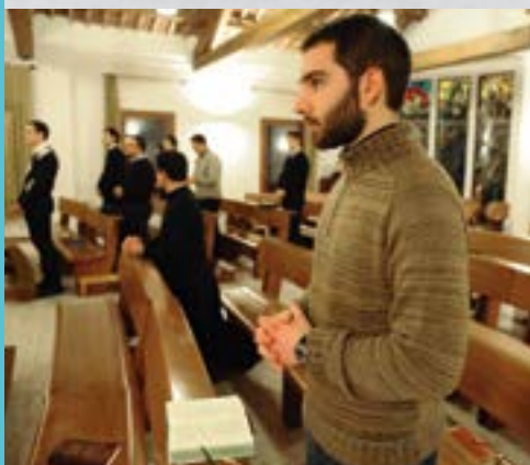
Giovane seminarista

LUOGO E DATA: sabato 11 giugno 2016, ore 15.30