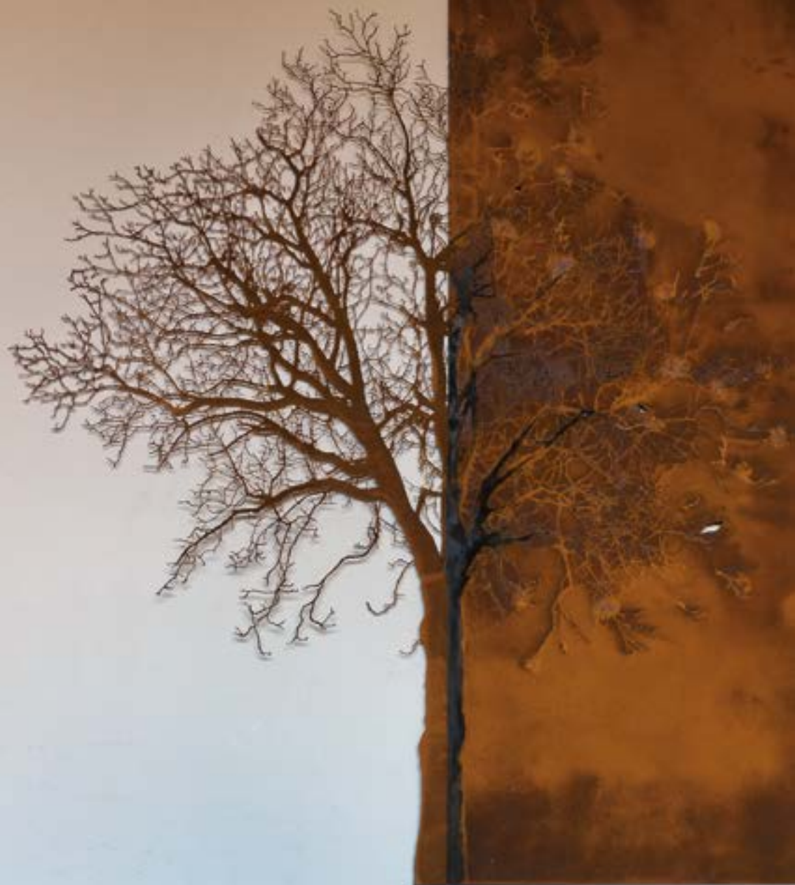
“L'Albero e la sua Impronta” di Paolo Albertelli - Mariagrazia Abbaldo 2015

c/o Curia di via Val della Torre 3 - Torino (mar. dalle 10 alle 12 su appuntamento) tel. 011 5156345; pastoralesport@diocesi.torino.it c/o parrocchia Immacolata Lingotto (merc. e ven. su appuntamento), tel. 011 3171351 parr.immacolata.lingotto@diocesi.torino.it