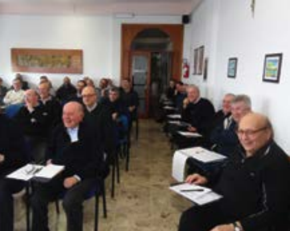
Gruppo di studio alla settimana residenziale di Diano Marina 2015