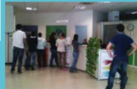
Uno sportello per l'impiego

Per ciascuna Giornata saranno divulgati appositi sussidi di riflessione