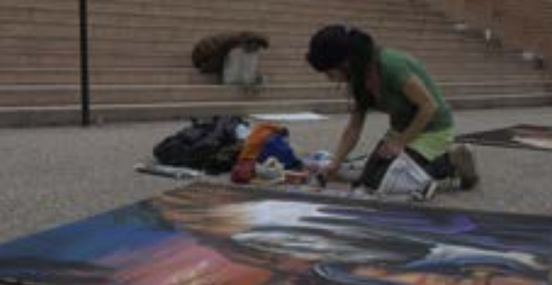
Madonnara all'inaugurazione della mostra "Holy Mystery" S. Volto 2015