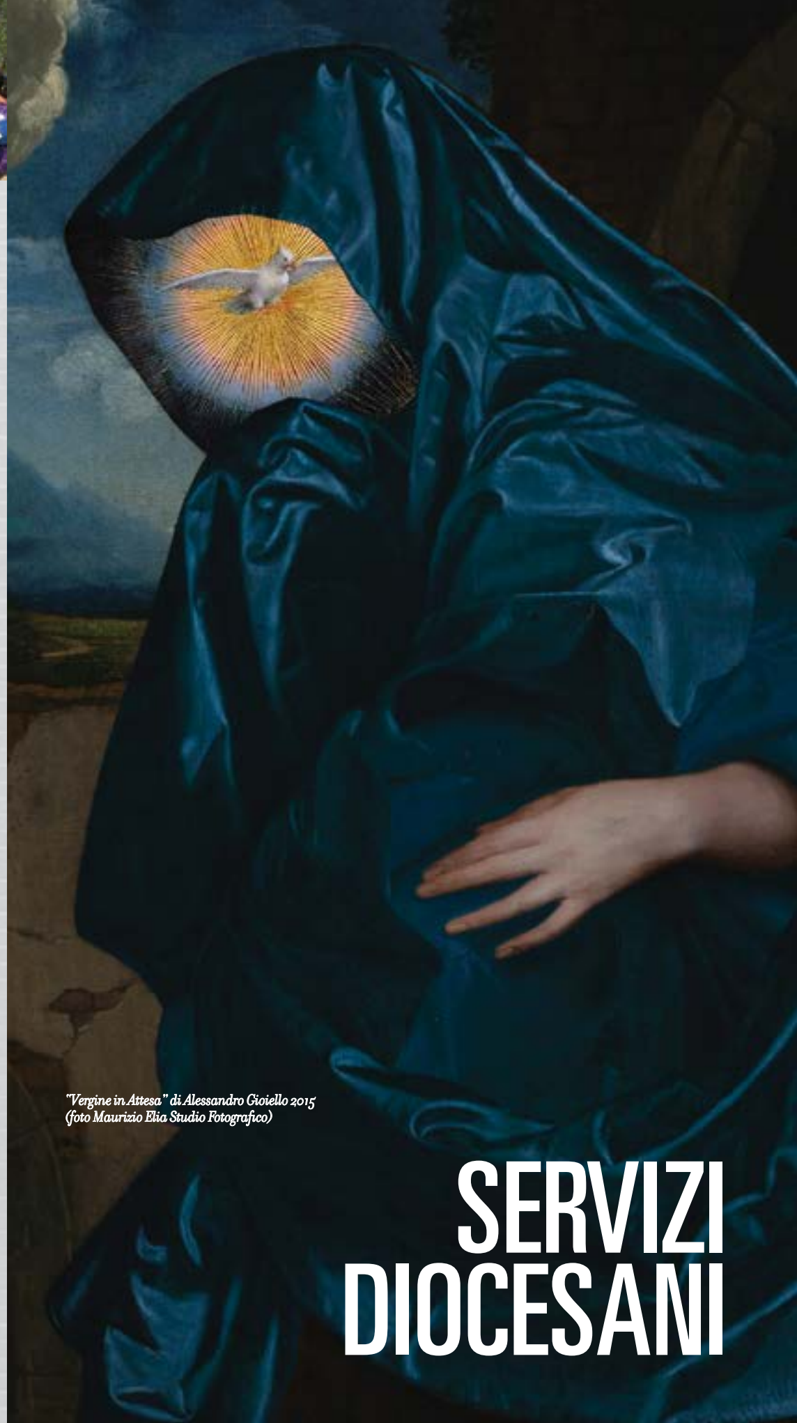
"Vergine in Attesa" di Alessandro Cioiello 2015

Infine fa capo alla sede dell'Ufficio torinese la Commissione regionale della Conferenza Episcopale Piemontese per la Pastorale del Tempo Libero, Turismo e Sport (vedere l'apposita sezione sul sito).