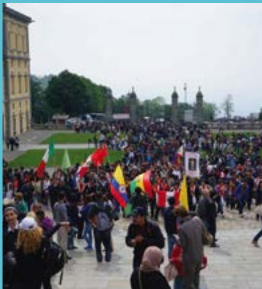
Pellegrinaggio interregionale dei migranti a Oropa (2014)

IN COLLABORAZIONE CON: Fondazione Migrantes BREVE DESCRIZIONE: Presentazione dei contenuti del Rapporto, con particolare riferimento all'analisi dell'evoluzione del fenomeno rispetto agli anni passati e del senso di appartenenza delle comunità italiane all'estero.