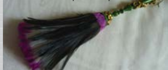
Piumino ottocentesco per spolvero tovaglia su cui i Savoia stendevano la Sindone per le Ostensioni private

via dell'Arcivescovado, 12 - Torino Orari: da lun. a ven. h. 9-12 Tel. 011 5156271, fax 011 5156273 archivio@diocesi.torino.it