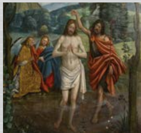
In alto, Spanzotti G. M. (1510). Battesimo di Gesù Cristo da cattedrale metropolitana di San Giovanni Battista di Torino

Per l'anno pastorale 2015 - 2016 il Settore intende proseguire nell'attività di studio e di conoscenza dell'arte cristiana. Il corso di quest'anno, svolto presso l'Istituto Superiore di Scienze Religiose di Torino, sarà dedicato alla nascita e allo sviluppo dell'arte cristiana dalle origini ai nostri giorni, visitato nelle sue principali espressioni architettoniche e iconografiche.